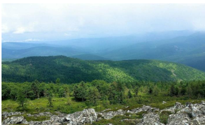
Общий вид заповедника «Бастак» (Приамурье)