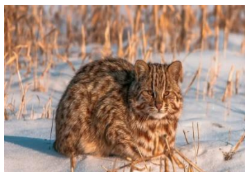
Амурский лесной кот