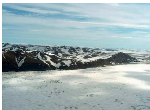
Общий вид Усть-Ленского заповедника